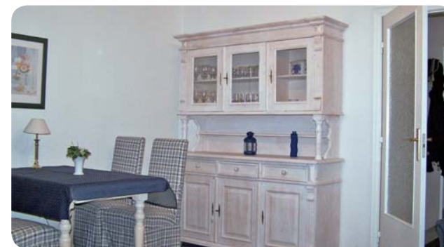
Das Haus Typ 2 besticht besonders durch seine geschmackvolle und hochwertige Einrichtung.

Und sonst? In der Nähe unserer Ferienhäuser beginnen herrliche Rad- und Wanderwege zu den schönsten Routen der Insel, unter anderem zum Rantumbecken und nach Keitum. Hier steht Ihrer abwechslungsreichen Freizeitgestaltung nichts im Wege. Ein Kinderspielplatz und ein Restaurant sind nur wenige Meter von unseren Häusern entfernt.