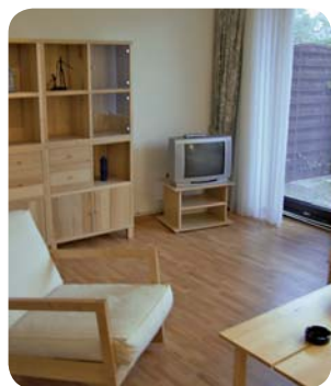
Gemütlich und hell präsentiert sich unser Haus Typ 1.

Unsere Häuser: Die Häuser vom Typ 1 verfügen im Erdgeschoss über ein Wohn-/Esszimmer, Küche, Bad und Diele mit Garderobe. Unsere nordisch eingerichteten Wohnzimmer verfügen über einen Essplatz, zwei gemütliche Sofas, Schaukelstuhl, Schrank, zwei Couchtische und TV. Die Küche ist ausgestattet mit E-Herd, Kühlschrank mit Gefrierfach, Mikrowelle, Toaster, Kaffeemaschine und Wasserkocher. Das Bad mit WC, Handwaschbecken und Dusche. In der ersten Etage befinden sich die beiden Schlafzimmer sowie das zweite Bad. Das große Schlafzimmer verfügt über ein Doppelbett sowie einen großen Kleiderschrank und hat direkten Zugang zum Balkon . Das kleinere Schlafzimmer ist mit einem Schlafsofa (200 x 160 cm in Liegestellung), Kommode, Couchtisch und Sessel ausgestattet. Das Bad mit WC, Handwaschbecken und Badewanne.